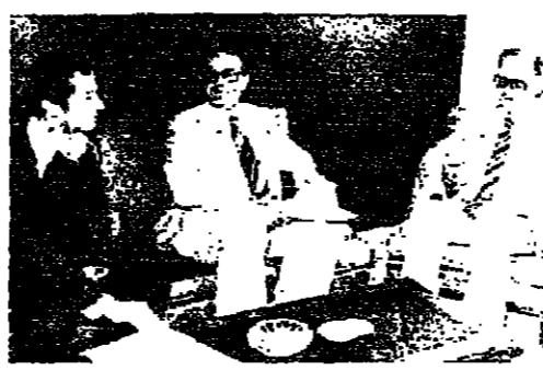
الرئيس الحص... مع السيد الوزير...

علاج الحص في وزارة الاقتصاد قضايا الصناعة واللحوم والتربة والكتب المدرسية... وزير الاقتصاد الحص يعالج في وزارة الاقتصاد قضايا الصناعة واللحوم والتربة والكتب المدرسية